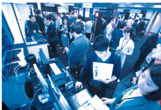
After NAB Show Osaka 2014 (グランフロント大阪)

詳細情報は Website をご参照ください。 http://www.after-nab.jp